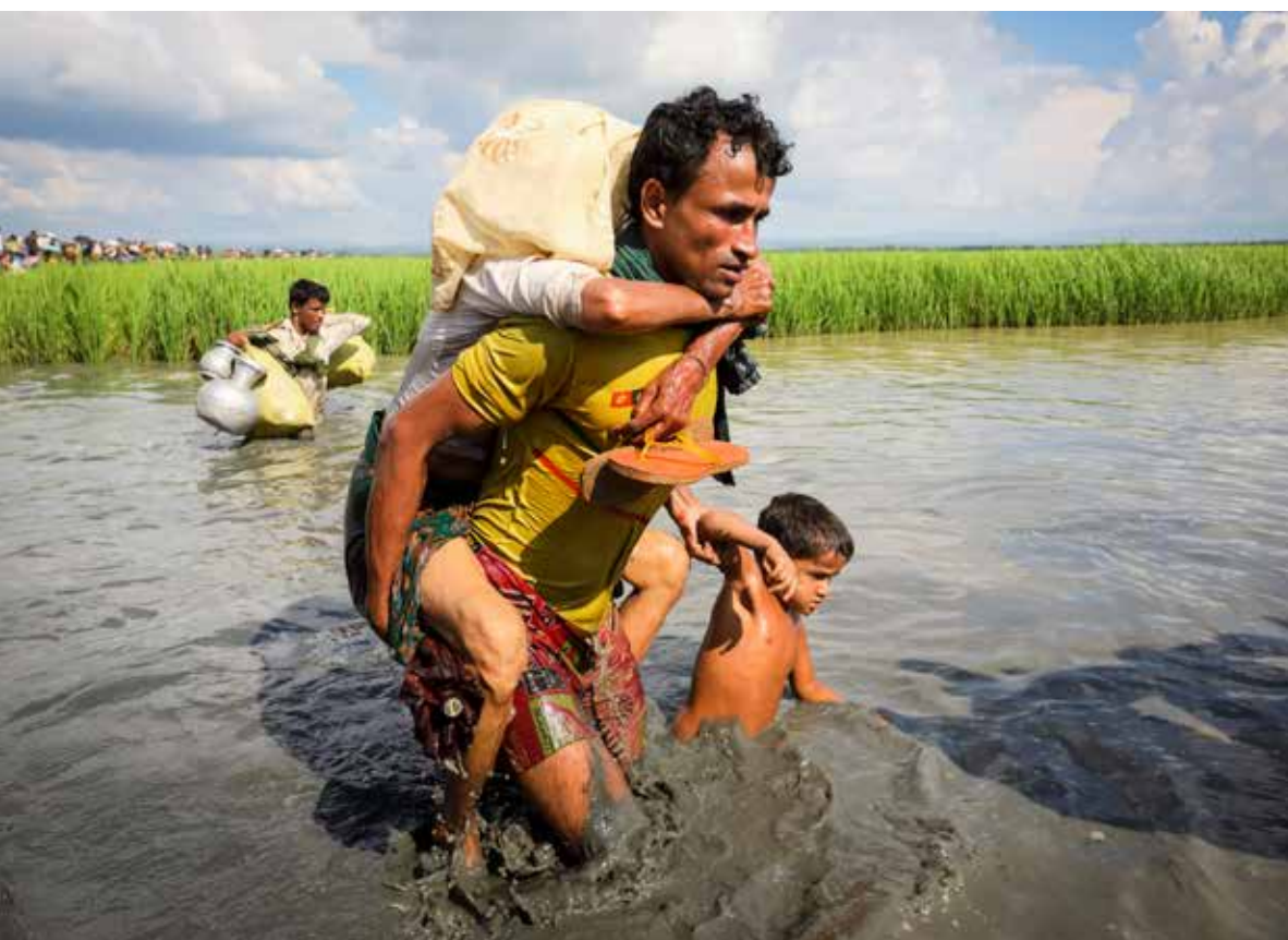
Rohingí utečenci sa brodia vodným kanálom pri úteku z Mjanmarska do Bangladéša.

K migrácii, ktorá je neodmysliteľnou súčasťou našej éry, prispievajú mnohé faktory, medzi nimi napríklad konflikty, urbanizácia, zmena klímy, globalizácia a mnohé ďalšie. No v rámci toho, ako sa stovky miliónov ľudí presúvajú medzi rôznymi mestami, krajinami a kontinentmi, v rámci tohto širšieho procesu, sa dá nájsť aj čosi iné. Osobitá skúsenosť, ktorá dokáže ovplyvňovať a formovať každý jeden kúsok cesty migrujúcich ľudí. Tou skúsenosťou je ich menšinová príslušnosť.