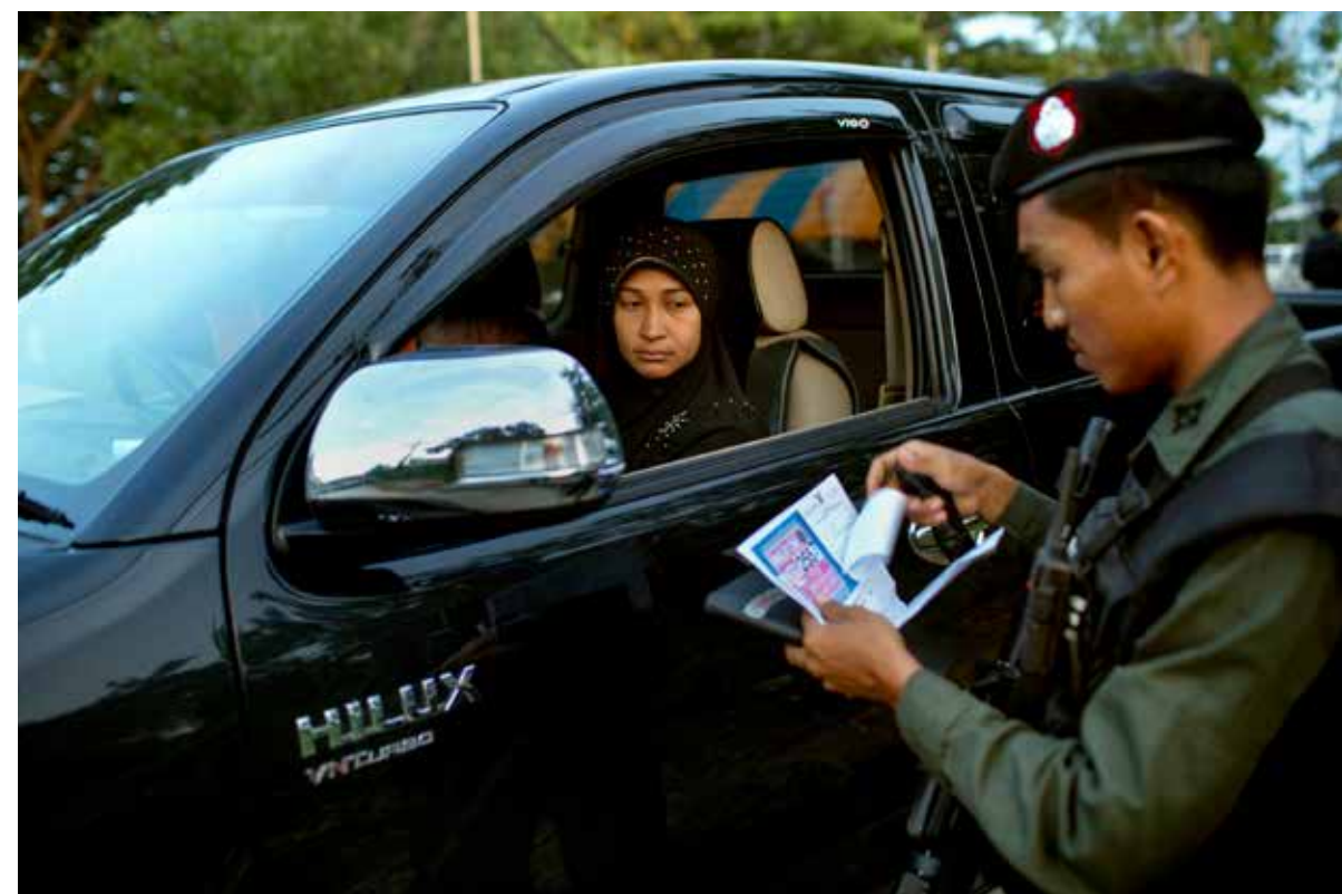
Thajský policajt kontroluje doklady moslimskej žene na checkpointe v Pattani na samom juhu krajiny.

V juhovýchodnej Ázii viedol rapídny rozvoj a využívanie prírodných zdrojov k presídleniu mnohých pôvodných obyvateľov, s mnohými spoločenstvami v Kambodži, Laose a Vietname vystávanými pri budovaní vodných elektrární na rieke Mekong. Devastáciu životného prostredia, od ktorého tieto komunity závisia, umožňujú bezzubé politiky, korupcia a zakorenená diskriminácia. V Indonézii, kde sa celé plochy pôvodných lesov stávajú obeťou drevospracujúceho priemyslu, výstavby plantáží palmy olejnej či ťažobných spoločností, je jedným z prispievajúcich faktorov chýbajúce právne postavenie pôvodného obyvateľstva – len veľmi malý zlomok z miliónov hektárov pôdy, ktoré tieto komunity v rámci zvykového práva vlastnili a spravovali, bol aj právne uznaný za ich. Nádej dávajú opatrenia prezidenta Joko Widodoa, ktorý podporuje transfer pôdy pôvodných obyvateľov do ich rúk, čo môže v budúcnosti pomôcť zastaviť aktuálnu vlnu kľčovania lesov a vystávaní tamojších obyvateľov.