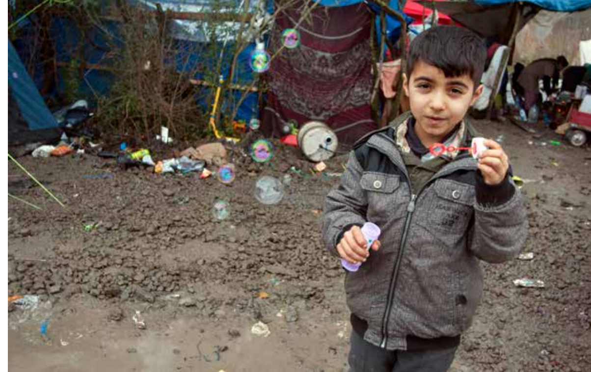
Chlapec robí bubliny v tábore neďaleko francúzskeho Dunkirku. Tábor obývajú predovšetkým kurdskí žiadatelia o azyl.

Výzvy však stoja aj pred tými, ktorým sa napokon podarí dosiahnuť plánovanej destinácie. Napríklad v Európe, kam pred konfliktmi a marginalizáciou utiekli milióny ľudí z Afriky, Ázie či Blízkeho východu a kde sú dnes „hostami“, sa diskusia opakovane zameriava na počet doterajších príchodov, rozsah podpory, ktorá by mala byť prichádzajúcim poskytnutá, či ako by mali byť rozdelení naprieč svetadielom, ak teda vôbec. Táto línia myslenia, čoraz viac ovládaná hlasmi politickej pravice, sa zvyčajne zameriava na kvóty, hranice, obmedzenia a podobne. Avšak pohľad na vysoký počet utečencov a migrantov v Európe ako na skupinu, ktorá bude pravdepodobne v dohľadnej budúcnosti predstavovať významnú menšinu, prináša aj rôzne iné otázky. Akým výzvam budú čeliť pri snahe stať sa akceptovanou súčasťou spoločnosti? Ako sa im v tom dá pomôcť? A aké zdroje a nástroje, od bývania a jazykových kurzov, až po vzdelávanie a poradenstvo, sú potrebné k dosiahnutiu tohto cieľa?