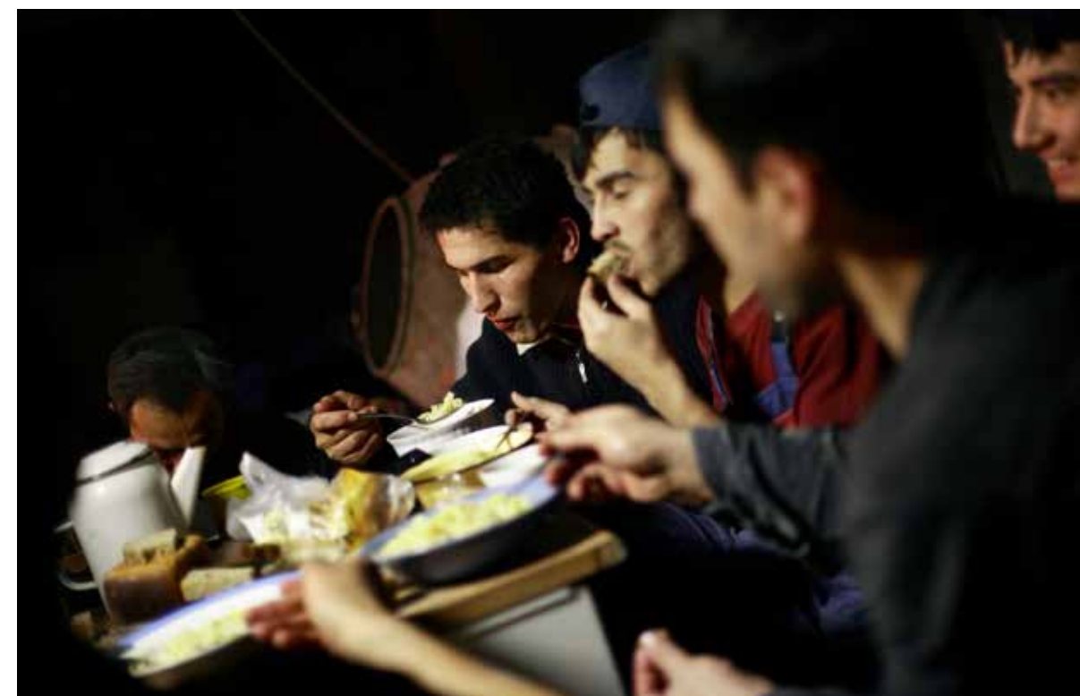
Migrujúci pracovníci z Uzbekistanu pri jedle v ich dočasných príbytkoch na stavenisku v Moskve.